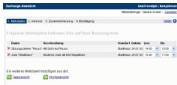
Der Reservations-Assistent führt Schritt für Schritt durch die Buchung. Selbst gänzlich unerfahrene Benutzer finden sich auf Anhieb zurecht.

Das Ergebnis: Ihr Reservationsprozess lässt sich wesentlich schneller, sicherer und komfortabler gestalten.