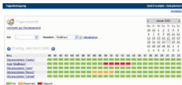
Welcher Raum ist noch frei? Die grafische Übersicht zeigt es auf einen Blick.

Verschiedene grafische Darstellungen wie die Tages- oder Wochenübersicht verschaffen Übersicht. Die verfügbaren Räume und Objekte sind immer auf einen Blick ersichtlich.