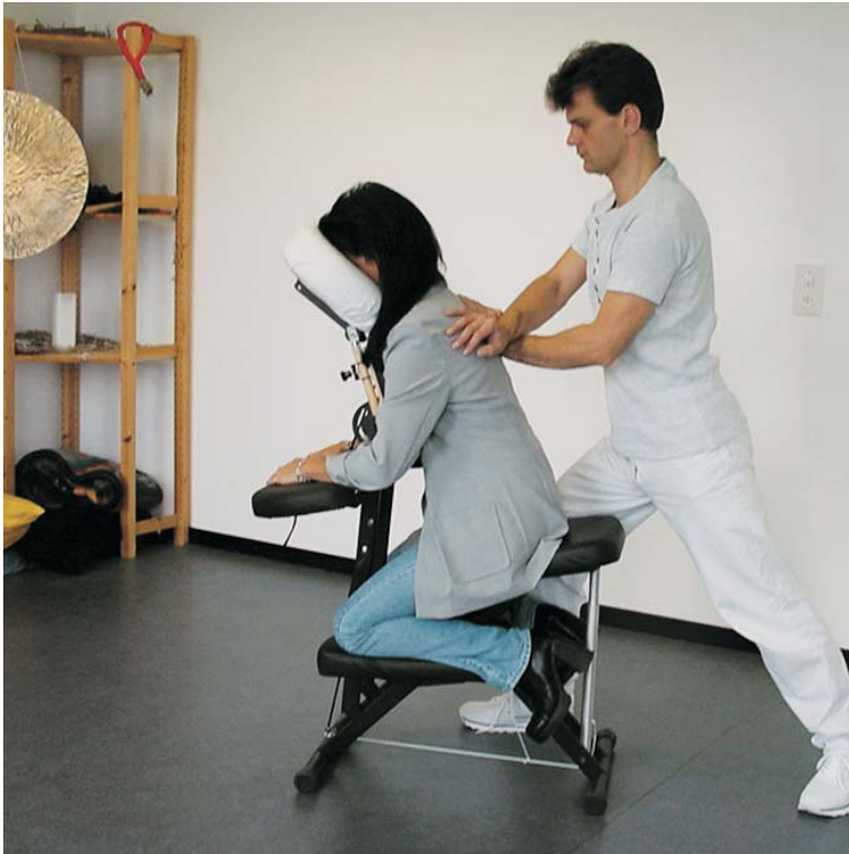
Die fresh-up Massage wird am Arbeitsplatz auf einem speziell dafür entwickelten Massagestuhl ausgeübt